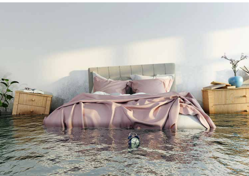
Abb. ©marog-pixcells - stock.adobe.com

Apropos Wasser: Grundsätzlich können im Schadensfall verschiedene Versicherungen zum Zuge kommen. Sollte sich wider Erwarten Wasser aus dem Bett oder dem Aquarium einen Weg durch die Wohnung bahnen, übernimmt die Hausratversicherung den finanziellen Ausgleich der Schäden an Möbeln und sonstigem Inventar. Die hoffentlich vorhandene private Haftpflichtversicherung wird wichtig, wenn das Wasser einen Weg in die nebenan oder darunterliegende Wohnung findet und beim Nachbarn Schaden anrichtet. Sollte es tatsächlich auch zu Schäden am Gebäude kommen, ist bei Eigentümern die Wohngebäudeversicherung an der Reihe. Das Risiko, das von einem neuen Wasserbett oder Aquarium ausgeht, gilt allerdings als sehr überschaubar. Wesentlich wahrscheinlicher ist es, dass Geschirrspüler oder Waschmaschine einen Wasserschaden produzieren.